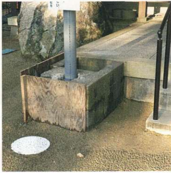
本堂正面の排水工事