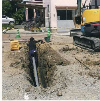
上下水道配管工事

七月二日の起工式の後、傍目には大きな変化は見られませんが、基礎工事の前に、上下水道の配管工事、本堂回りの排水工事等が行われていました。上水道の経費削減のため、当初計画よりも井戸水の併用を拡大しております。また、本堂周辺の排水工事も行われましたので、本堂正面の排水も改善されると思います。