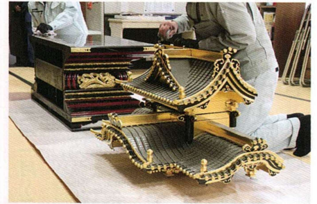
お内仏の分解・清掃